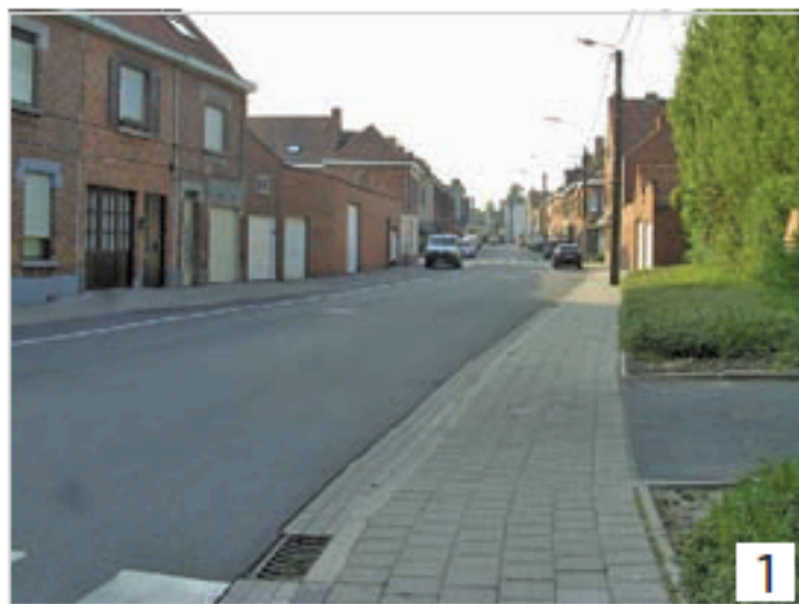
Herinrichting Ellestraat Zwevegem