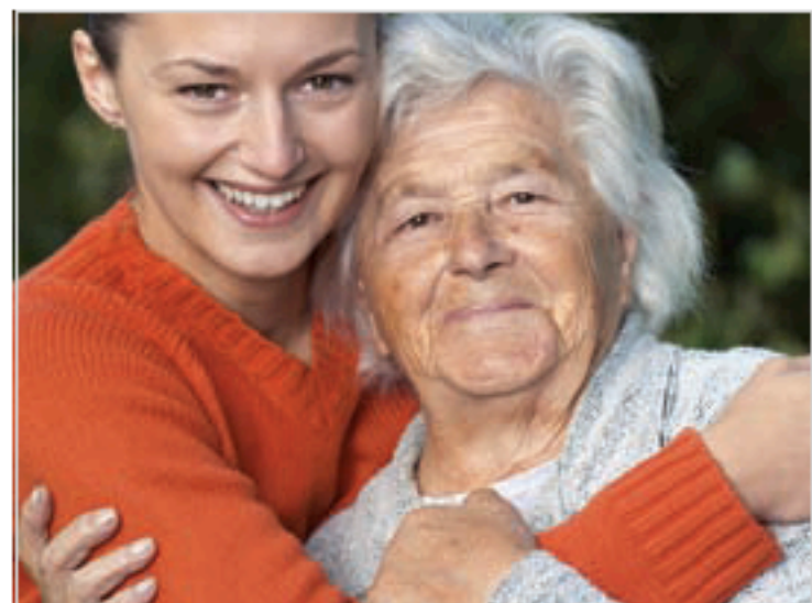
Opstart dossier uitbreiding woonzorgcentrum (100 → 150 plaatsen)