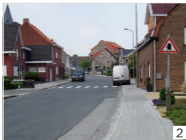
Vernieuwing voetpad Scheldestraat Otegem